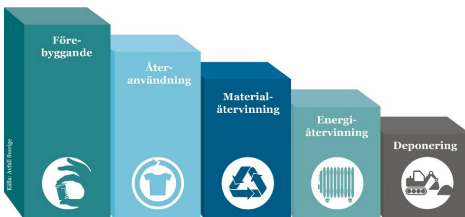
Figur 1. EU:s avfallshierarki

Planen styr främst kommunens arbete samt om rådighet finns påverkas även privat verksamhet, exempelvis gällande byggavfall och schaktmassor samt tillsyn.