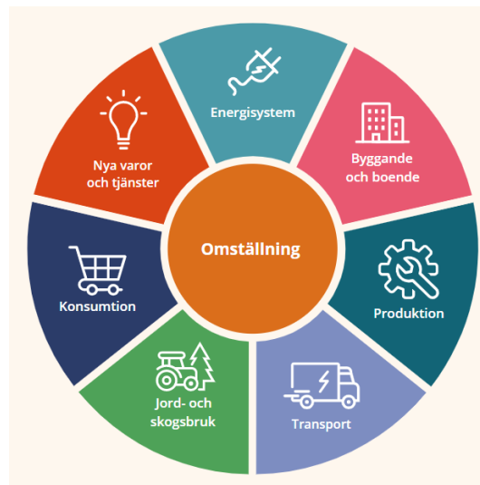
Figur 4 visar de fokusområden som Energiintelligent Dalarna arbetar med.

För detta ändamål kopplas kretsloppsplanens genomförande till det löpande arbetet i Energiintelligent Dalarna där mycket av länets strategiska arbete kring hållbarhet och resurshushållning drivs. Det gäller särskilt områdena konsumtion, byggande och boende, transport, energisystem och nya varor och tjänster.