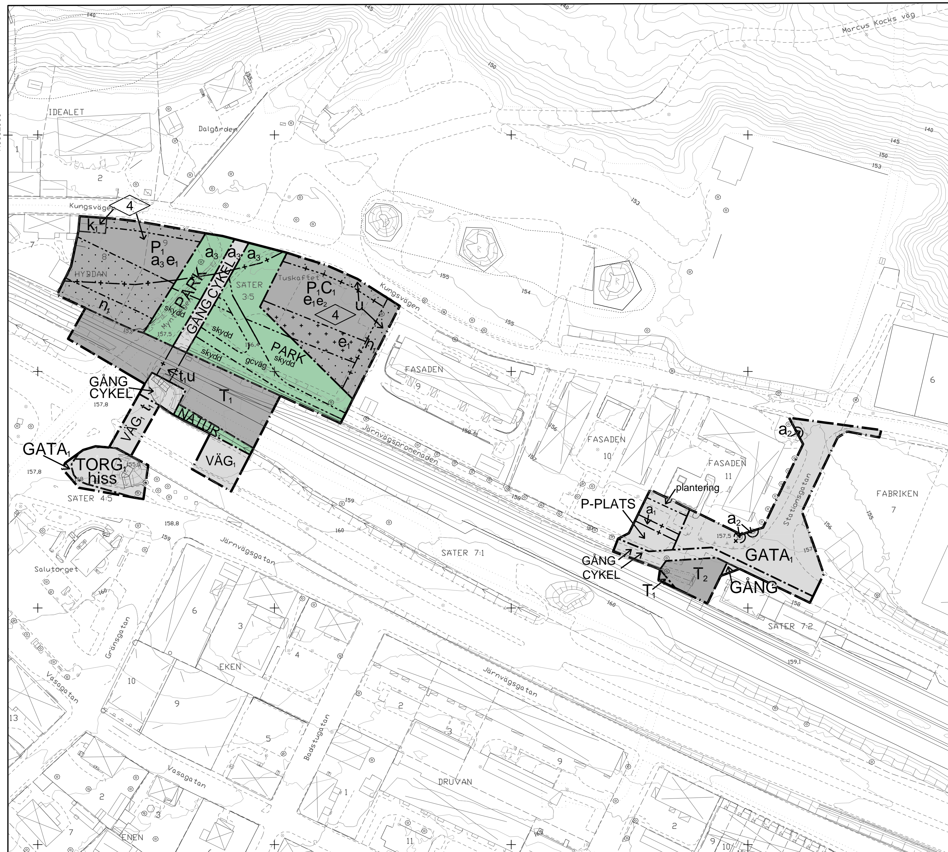
PLANKARTA Skala: 1:1000 (i format A1)